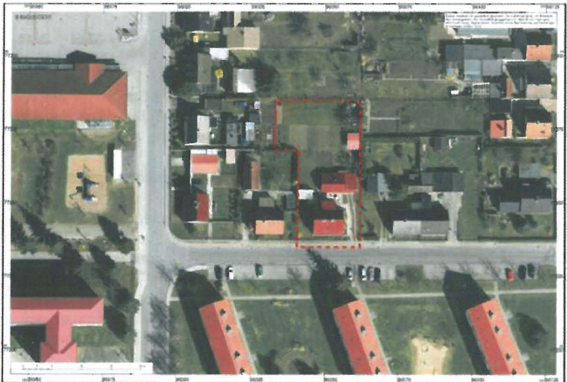
Abb. 2: Übersichtskarte, unmaßstäblich